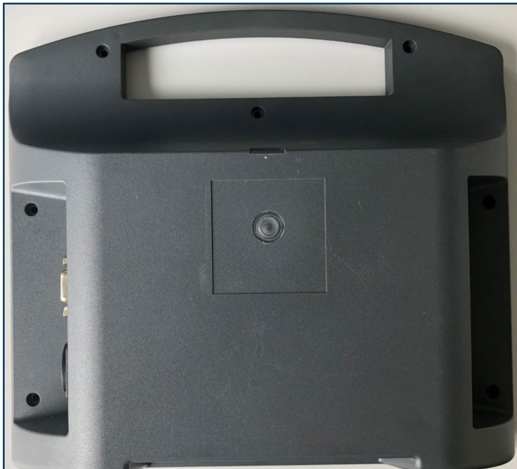
Exemplarisches Abbild einer NetBox